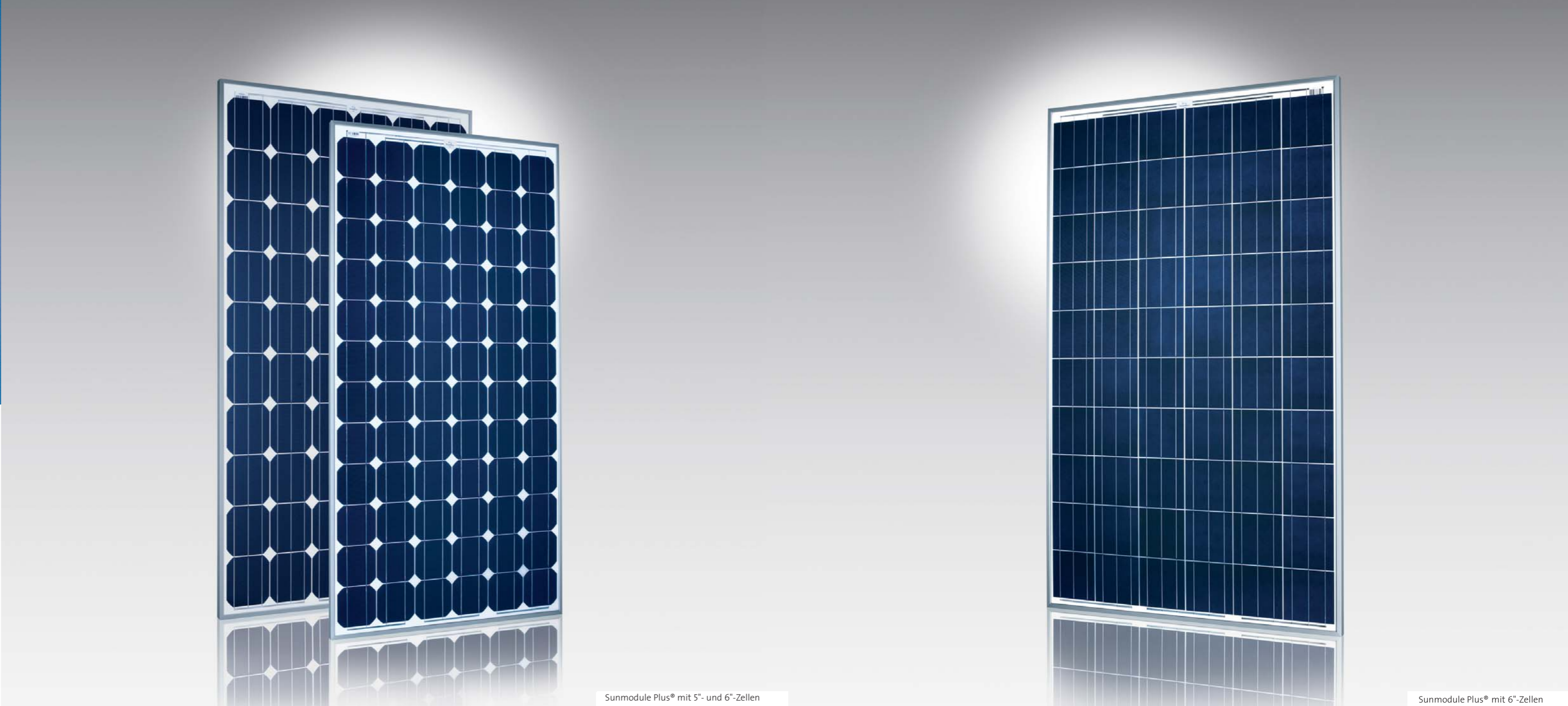
Sunmodule Plus® mit 5"- und 6"-Zellen